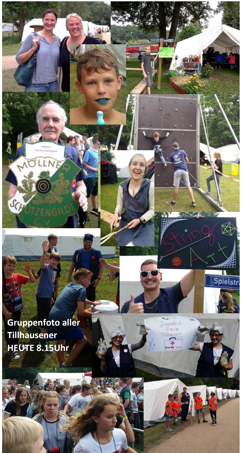
Gruppenfoto aller Tillhausener HEUTE 8.15Uhr

Gesunder Junge wird im Flugzeug mitten über dem Atlantik in einer Lufthansa-Maschine geboren. Mit Zwischenlandung und drei Ärzten an Bord ist alles gut gegangen.