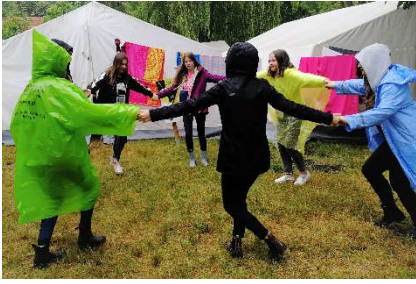
DANCING IN THE RAIN :D

Regen beim Aufstehen? Egal! Da tanzen wir drauf!