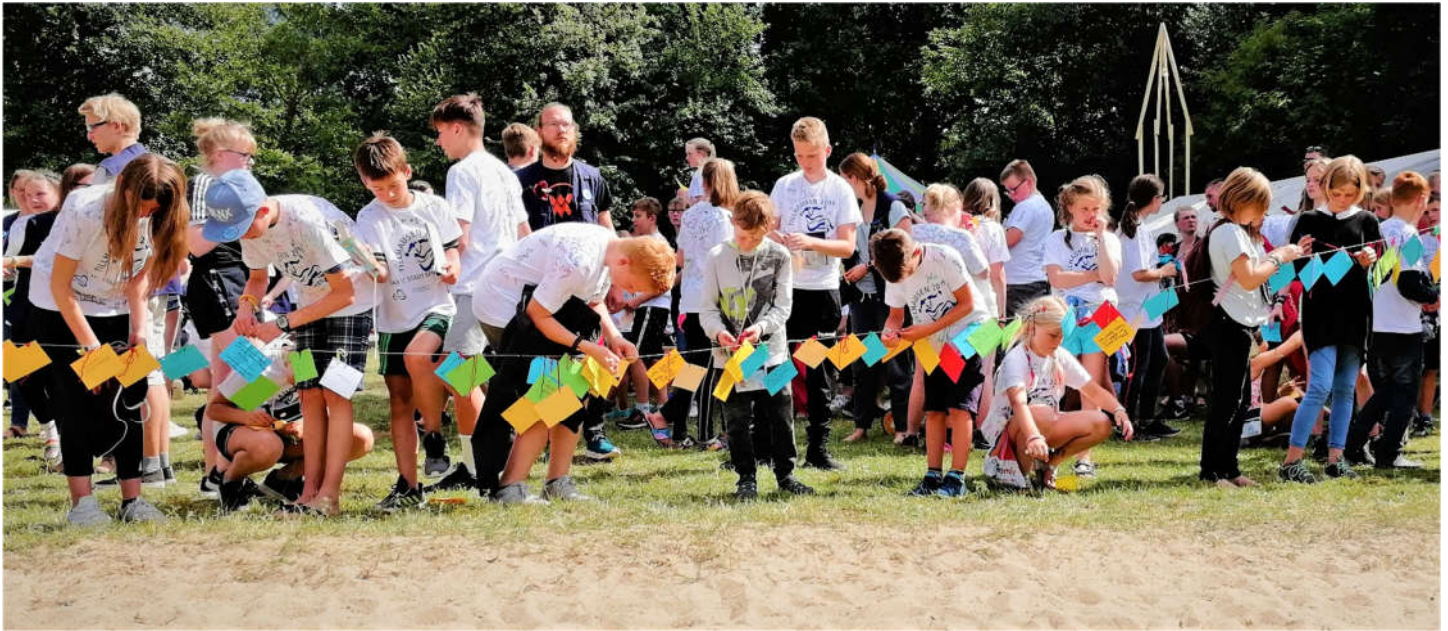
Die Tillhausener/innen geben auf bunten Karten in einer Andacht Feedback was ihnen am besten gefallen hat.